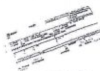
le billet de train