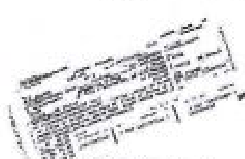
le billet d'avion