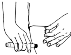
Coloque la punta del EpiPen contra el muslo