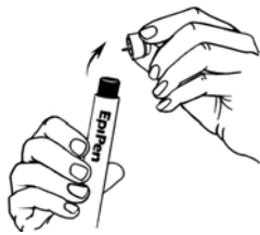
Quite la tapa