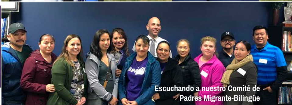
Escuchando a nuestro Comité de Padres Migrante-Bilingüe