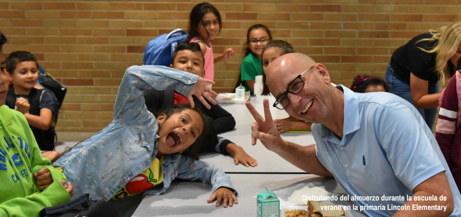
Disfrutando del almuerzo durante la escuela de verano en la primaria Lincoln Elementary