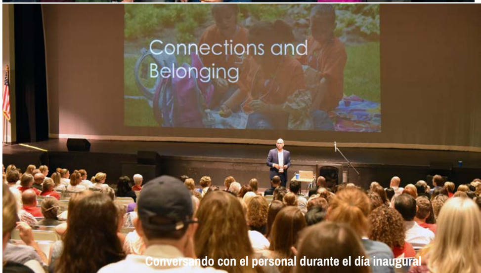
Conversando con el personal durante el día inaugural