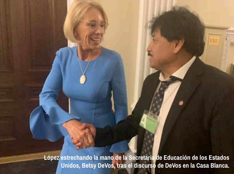
López estrechando la mano de la Secretaria de Educación de los Estados Unidos, Betsy DeVos, tras el discurso de DeVos en la Casa Blanca.

pasar por su escuela en su próximo viaje al estado de Washington.