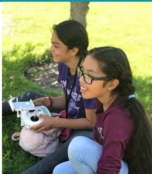
Los estudiantes controlando drones a través de una pista de obstáculos en el Wenatchee Valley College

Los estudiantes migrantes de 11° grado participaron en el Programa de Asistencia a Migrantes (CAMP, en inglés) del Wenatchee Valley College. El programa CAMP enriqueció el aprendizaje de los estudiantes con actividades de liderazgo para ayudarles a encontrar su potencial al establecer metas. El programa CAMP del WVC empodera a los estudiantes al ayudarles a construir una base sólida en su transición a la universidad. Los estudiantes también pudieron establecer una conexión con el programa GEAR UP de la Central Washington University en el área de STEM para profundizar su conocimiento por medio de proyectos en la comunidad de Wenatchee. Además de las habilidades que obtuvieron en liderazgo y STEM durante esta experiencia de verano, los estudiantes ganaron dos créditos de preparatoria y un impulso para empezar el nuevo año escolar con motivación y determinación.