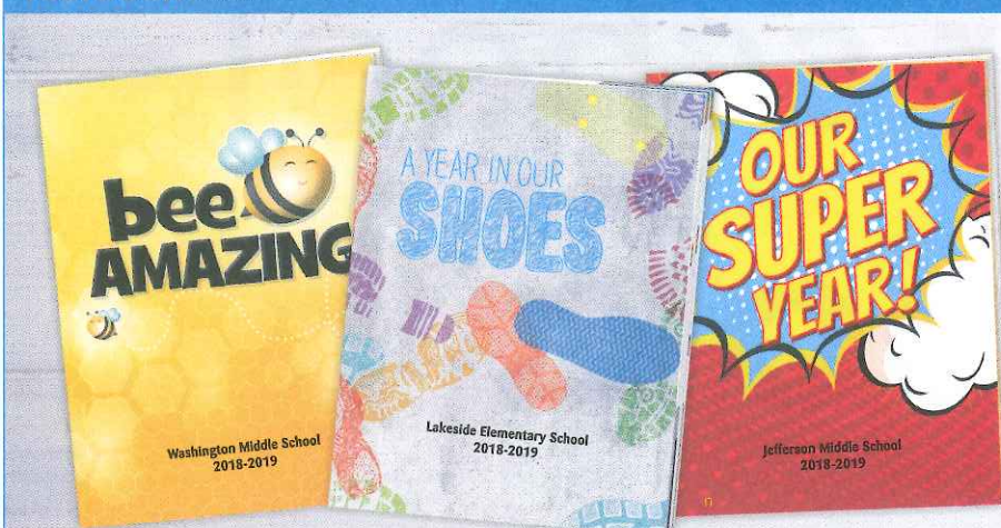
Yearbook design varies by school. El diseño del anuario varía según la escuela.